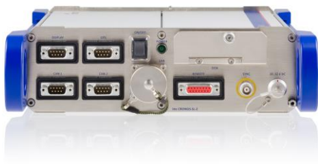
Robust & anwenderfreundlich: imc CRONOS-SL

Senvion hat sich für imc CRONOS-SL für die Verifikationsmessungen bei der Einzelblattmontage entschieden, weil es die oben genannten Anforderungen bestens erfüllt.