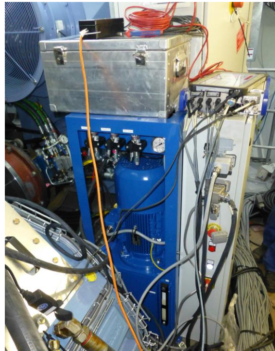
Im Einsatz: imc CRONOS-SL

dem autarken, PC-losen Betrieb, einschließlich Onboard-Speicher, kann der Nutzer das imc CRONOS-SL über eine Ethernet-TCP/IP-Schnittstelle (oder optional WLAN) mit einem Computer verbinden. Der Aufbau eines Messnetzwerkes mit beliebigen, weiteren und synchronisierten imc-Messgeräten ist ebenfalls möglich.