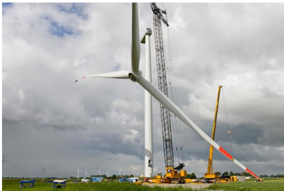
Die traditionelle Sternmontage (Bild) wird zunehmend von der Einzelblattmontage abgelöst

Im Vergleich zur traditionellen Rotorsternmontage werden bei der neuen Einzelblattmontage die Rotorblätter nicht am Boden montiert und als Gesamtkonstruktion hochgezogen, sondern einzeln an der Nabe der stehenden Konstruktion installiert. Vorteile der Einzelblattmontage sind u.a. die Reduktion der Lagerkapazitäten und der kleinere Flächenbedarf beim Aufbau sowie der Verzicht auf zwei Großkräne (wie sie bei der Sternmontage erforderlich sind).