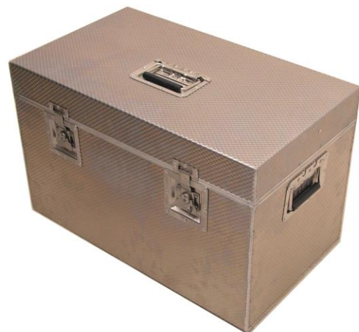
Das Montagepersonal hat die Messtechnik-Ausrüstung immer im Griff