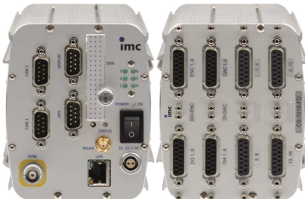
Gerätetyp: CS-1016 (Abb. ähnlich), 16 analoge Messeingänge

Intelligentes Kompaktmessgerät für Spannungsmessungen mit umfangreicher Zusatzausstattung