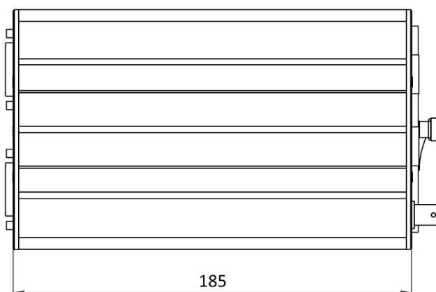
Die Abbildung zeigt ein CS Gerät in Standard-Gebrauchslage.