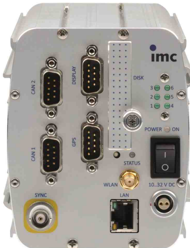
Gerätetyp: CS-3008-FD (Abb. ähnlich), 8 analoge Messeingänge

Das Kompaktmessgerät für den direkten Anschluss von ICP-Sensoren