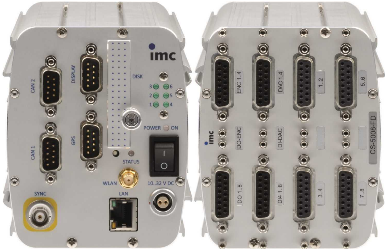
Gerätetyp: CS-5008-FD, 8 analoge Messeingänge

Intelligentes Kompaktmessgerät für DMS- und Brückenmessungen