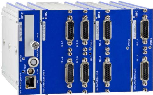
imc CANSASflex Module als Block (Klick-Verbindung) mit imc BUSDAQflex Logger (links)