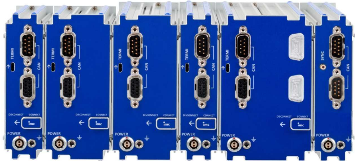
Rückseite des Blocks: CAN, Versorgung, Terminator, Verriegelungsschieber