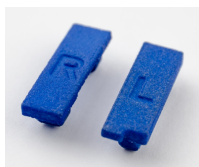
CANFX/COVER-IP40: Set bestehend aus linker und rechter Schutzkappe