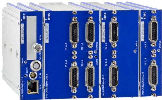
imc CANSASflex Module als Block (Klick-Verbindung) mit imc BUSDAQflex Logger (links)