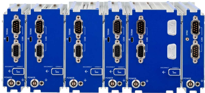
Rückseite des Blocks: CAN, Versorgung, Terminator, Verriegelungsschieber