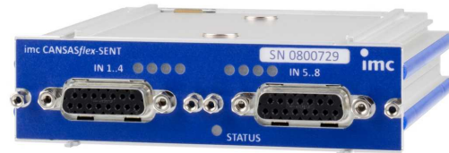
imc CANSASflex-PWM8 (Abb. ähnlich)

Das CAN-Bus Modul imc CANSASflex-PWM8 gibt auf acht Kanälen Pulsweiten-modulierte Signale aus. Die gewünschten Signalausgaben können dabei direkt aus einer CAN-Botschaft entnommen werden oder mittels der Eigenintelligenz des Moduls aus Verrechnungen von empfangenen CAN-Botschaften oder vorgegebenen Funktionen (z.B. Rechteck, Sägezahn usw.) bestimmt werden.