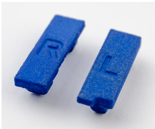
Set bestehend aus linker und rechter Schutzkappe