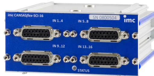
imc CANSASflex-SC16 (Abb. ähnlich)

Modulausführungen mit DSUB-15 Anschlussstechnik unterstützen alle Messmodi. Varianten mit alternativer Anschlussstechnik wie z.B. Thermobuchsen dagegen nur ausgewählte Messmodi wie Thermoelement.