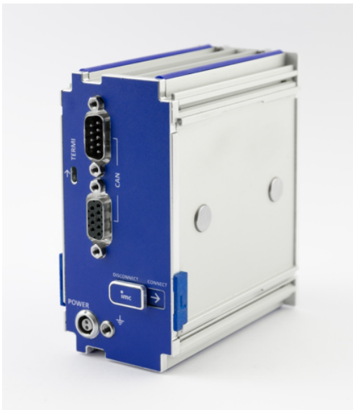
linke Schutzkappe (gekennzeichnet mit "L")

Gerätecertifikate und Kalibrierprotokolle: Detaillierte Informationen zu mitgelieferten Zertifikaten, den konkreten Inhalten, zugrundeliegenden Normen (z.B. ISO 9001 / ISO 17025) und verfügbaren Medien (pdf etc.) sind der Webseite zu entnehmen, oder Sie kontaktieren uns direkt.