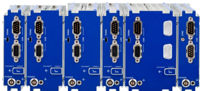
Rückseite des Blocks: CAN, Versorgung, Terminator, Verriegelungsschieber