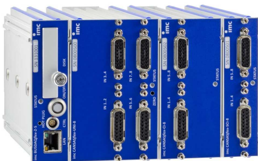
imc CANSASflex Module als Block (Klick-Verbindung) mit imc BUSDAQflex Logger (links)