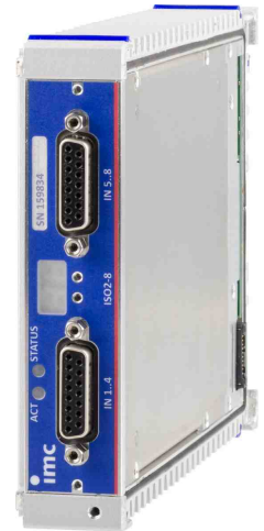
CRXT/LV3-8 (Abb. ähnlich)