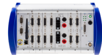
imc CRONOScompact Tragegehäuse