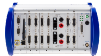
imc CRONOScompact Tragegehäuse