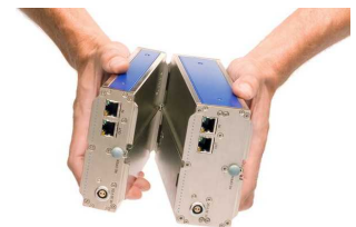
imc Klick Mechanismus