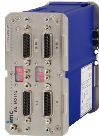
imc CRONOSflex Modul (CRFX/DI2-32)

Das so gebildete Messsystem wiederum ist über eine gewöhnliche Ethernet Verbindung (LAN / WLAN) mit einem PC zu steuern, der als Konfigurator und Messdatensenke fungiert.