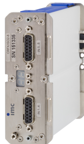
CRFX/ISO2-8 Darstellung des Moduls in Gebrauchslage