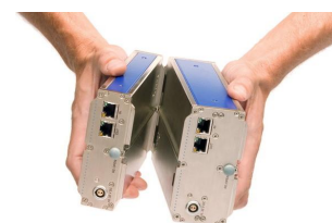
imc Klick Mechanismus

Das so gebildete Messsystem wiederum ist über eine gewöhnliche Ethernet Verbindung (LAN / WLAN) mit einem PC zu steuern, der als Konfigurator und Messdatensenke fungiert.