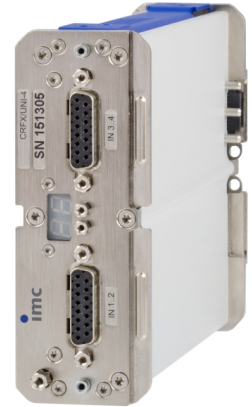
CRFX/BR2-4 (Abb. ähnlich)