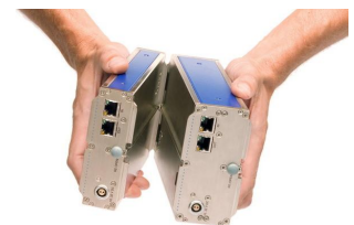
imc Klick Mechanismus

Das so gebildete Messsystem wiederum ist über eine gewöhnliche Ethernet Verbindung (LAN / WLAN) mit einem PC zu steuern, der als Konfigurator und Messdatensenke fungiert.