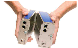
imc Klick Mechanismus

Das so gebildete Messsystem wiederum ist über eine gewöhnliche Ethernet Verbindung (LAN / WLAN) mit einem PC zu steuern, der als Konfigurator und Messdatensenke fungiert.