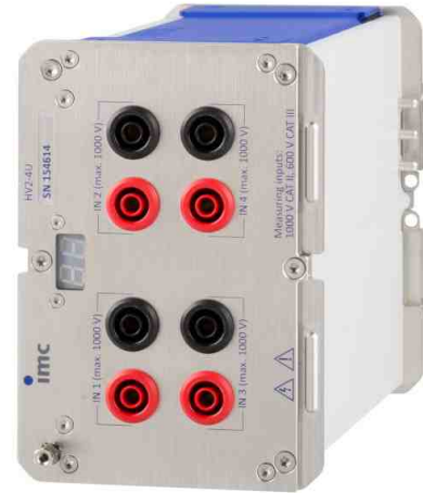
imc CRONOSflex Modul zur Erfassung hoher Spannungen (CRFX/HV2-4U)