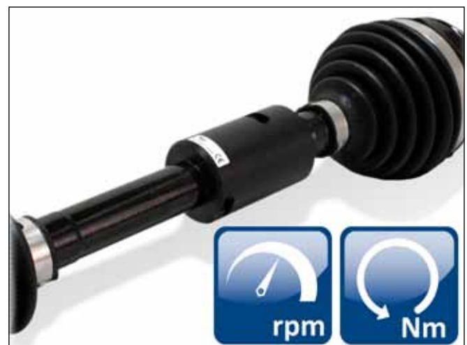
▲ Halbschalengehäuse auf DMS applizierter Welle mit integrierter Dx-Sendeeinheit und Drehratensensor.