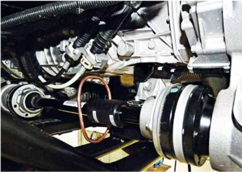
▲ Installiertes Leistungsmesssystem mit induktiver Spannungsversorgung am Fahrzeug.

z. B. bei Fahrten mit einem Fahrzeug die Welle unregelmäßig auf und ab bewegt, hat keinen Einfluss auf das Messergebnis. Ein weiterer Stator, eine mechanische Verbindung zu einem stationären Teil oder zur Karosserie sind dabei nicht nötig: Das System kommt ohne zusätzliche Fixpunkte aus. Zudem ist der Sensor schockresistent bis \pm 10.000\text{ g} und kann für Drehzahlen bis \pm 7.200\text{ U/min} eingesetzt werden. Die erreichte Genauigkeit ist besser als 0,5\% . Möglich wird dies durch den Einsatz eines auf der MEMS-Technologie (Micro Electro-Mechanical Systems) basierenden Gyroskops. In diesem Sensor greifen Kammgitterstrukturen ineinander. Bei Rotation werden diese über die Corioliskraft gegeneinander ausgelenkt. Dadurch ändert sich die Kapazität zwischen den Gittern proportional und die Rotation kann mit sehr hoher Auflösung gemessen werden. Durch die intelligente Verschaltung im gesamten Sensorsystem werden Störfaktoren größtenteils ausgeschaltet. Auch der bei diesen Sensoren übliche Temperaturdrift wird kompensiert, über den weiten Bereich von -40\text{ °C} bis +85\text{ °C} . Dadurch wird die Drehratensmessung sehr präzise. Das Drehmoment wird von einem Sensor auf der